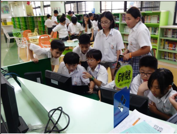
利用圖書館電腦查閱資料