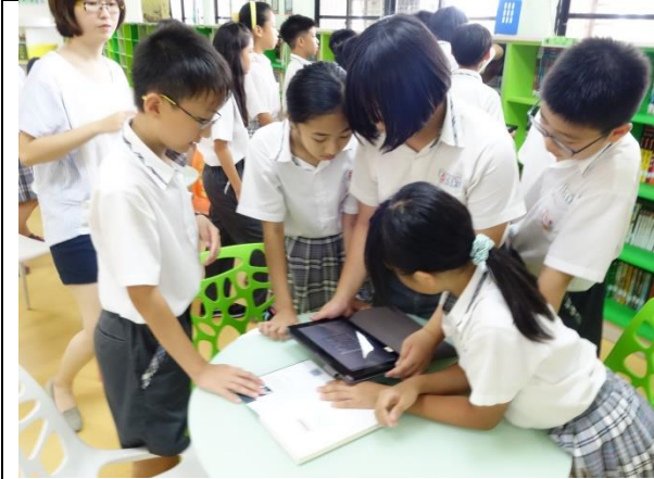
掃描 qrcode 以連結 googleclassroom