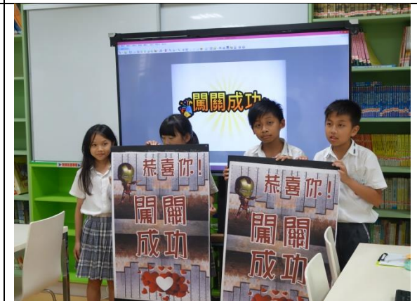
終於闖關成功，不容易喔!

肆、上傳教案：請將本附件一「主題學習 APP 地圖」教案，上傳至計畫網站「主題學習 APP 地圖-我要投稿」(檔案限制20MB 以下 PDF 檔)。