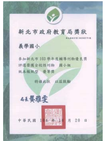
優良輔導刊物獎狀

下學期還規劃了各年級特教體驗、小團體輔導（人際關係、團體適應）、參訪創世基金會…活動。這些活動都是希望能讓孩子學習到「愛惜自己、尊重他人，懂得付出、擁有同理心」的美德。當然，家長的身教、言教更為重要，如果家長也能夠先了解生命教育的意義，體認到生命教育的重要性，以身作則實現這些美德，才能幫助您的孩子在成長的過程中克服障礙，珍惜生命，共同學習，共同成長。