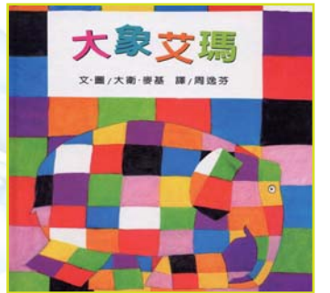
欣賞與眾不同的自己——大象艾瑪