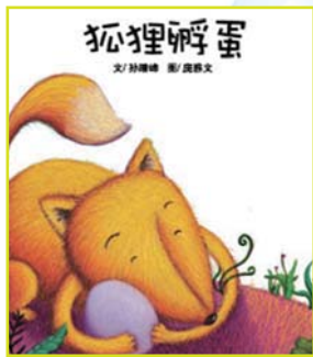
說愛大聲公——狐狸孵蛋