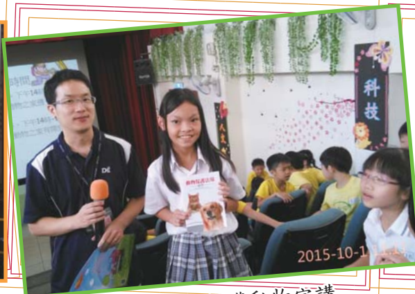
生命教育及保護動物宣講