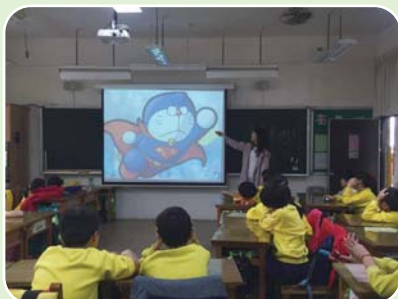
介紹壓力產生的原因