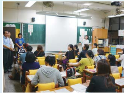
校長、會長與志工成員關心小一新生家長學生適應情況