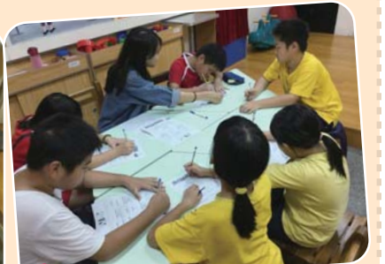
大家一起製作友情餅乾，活動結束後你對新朋友的了解有多少呢？