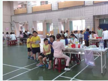
志工協助流感疫苗接種