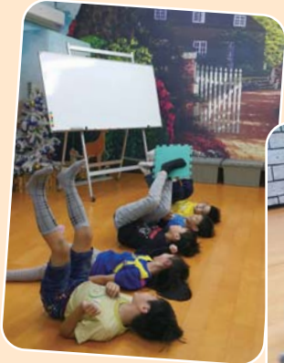
暖身小活動—一起合作把巧拼往前傳吧！