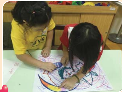
圖形聯想創作-在複雜的線條中，你找到哪些圖案呢？把它圈出來吧！

在學校除了學習之外，能夠交到知心好友是一件開心而且滿足的事情，想知道如何和新朋友相處嗎？和朋友聊天可以準備哪些話題呢？彼此之間發生了誤會又該怎麼辦？這些問題在團體裡都有機會和成員們一起討論唷！歡迎各位同學下次一起加入我們的團體課程。