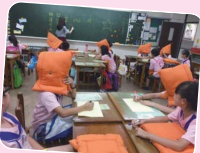
體會語言與非語言的神奇魔力