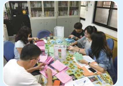
小朋友閱讀完繪本-象爸爸著火了-很用心完成學習單唷！