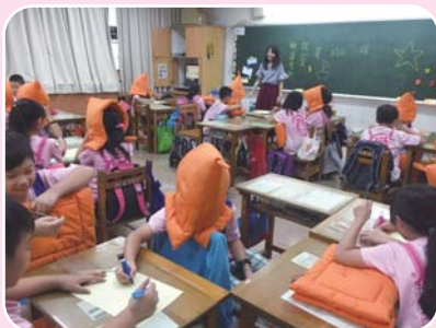
活動名稱-你是我的眼

很多時候我們只用語言跟別人溝通，有些人可以表達得很好，讓對方聽得懂自己的意思，但也有人覺得很困難，好像除了語言之外還差了那麼一點什麼。別忘了臉部表情、肢體動作等非語言訊息，可以幫助我們完整的表達出自己的意思！而當你是聽眾時，也記得要當一個會察「言」觀「色」的人唷！