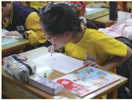
四年級特教體驗～口足畫家