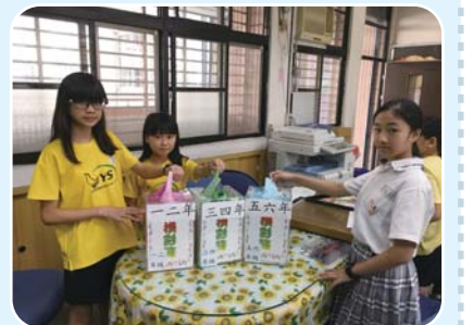
家庭暴力防治宣導活動

任何會傷害別人身體和心情的行為都稱之為「暴力」，所有的暴力都是不對的，因此「家庭暴力也是不對的」。發生家庭暴力不是因為小朋友不乖，也不是小朋友的錯，當你遇到這樣的事情，記得告訴身邊信任的大人（家人或是老師），我們一起來想想看可以怎麼幫忙你唷。