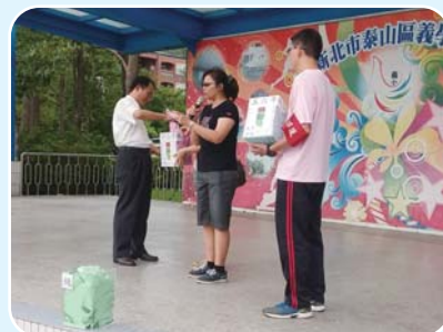
小鳳凰出任務摸彩時間，誰是幸運的中獎者呢^^