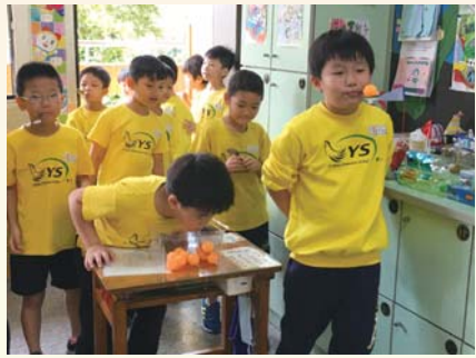
二年級特教體驗～積少成多

缺陷的朋友們！在孩子們的回饋中也提到「原來他們真的好辛苦哦！」、「我一定會盡我的能力去幫助他們」……，相信經過這次的活動，義學國小的孩子們一定都能對別人更多一些體貼和關懷的。