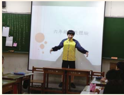
六年級特教體驗～比手畫腳