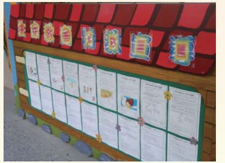
各班優良學習單作品展示