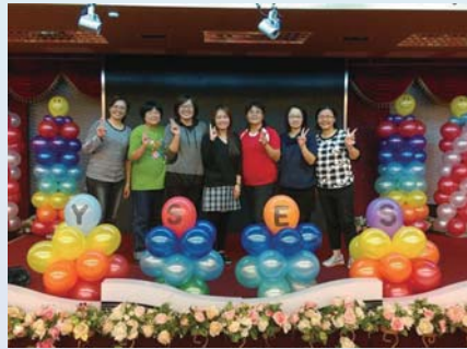
志工隊成員協助布置家長會長交接布置