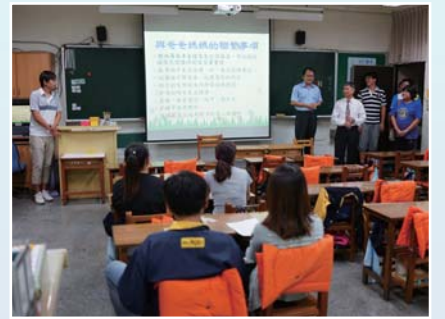
親師班級經營溝通