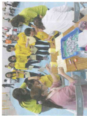
全校施打流感-志工協助