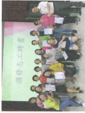
志工大會-頒發證書