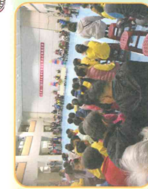
校園園遊會-開幕式