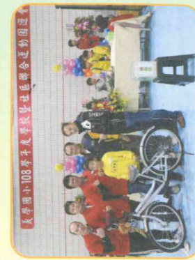
摸彩活動開心領獎