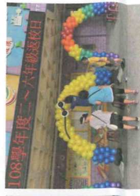
新學期始業式暨祖孫週活動 -布置會場