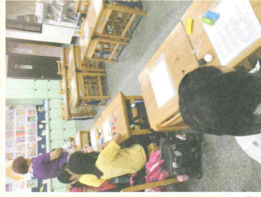
藉著創作發抒情緒，同時培養創造力