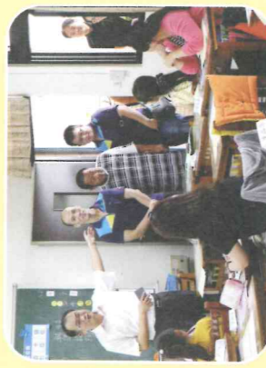
校長帶領主任、家長會會長到各班聆聽家長意見