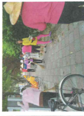
園藝志工 維護校園環境整潔