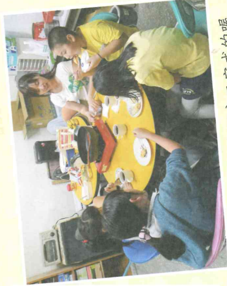
食物、飲料是我們分工完成的喔