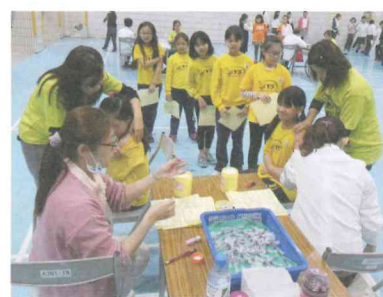
全校施打流感-志工協助