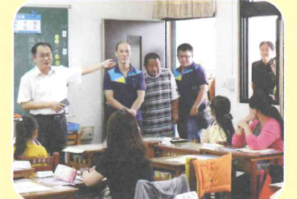
校長帶領主任、家長會長到各班聆聽家長意見