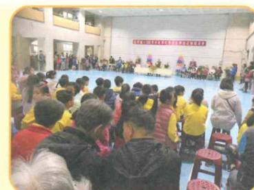
校慶園遊會-開幕式