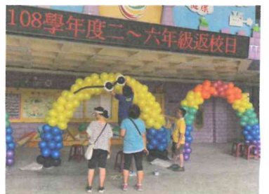
新生始業式暨祖孫週活動-布置會場