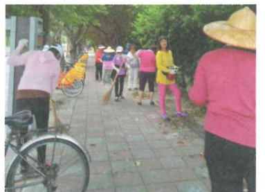
園藝志工 維護校園環境整潔