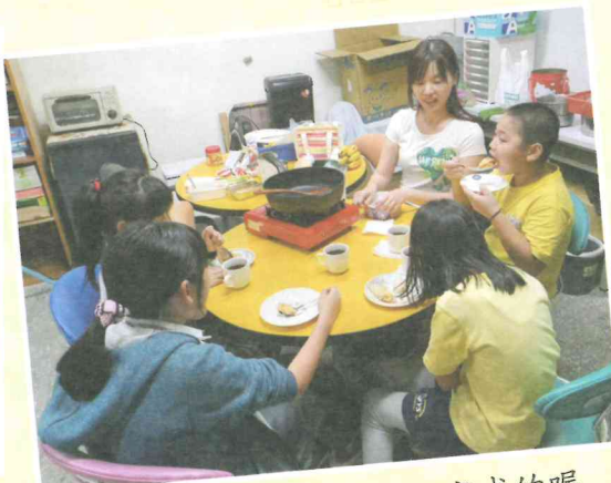
食物、飲料是我們分工完成的喔