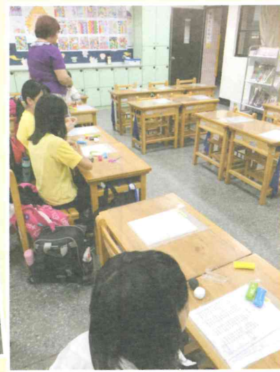
藉著創作抒發情緒， 同時培養創造力