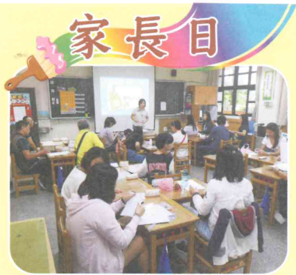
老師與家長做親師交流

新北市家庭教育中心亦提供諮詢專線421-8185提供夫妻相處、親子溝通、婚前交往、子女教養、家庭資源、自我調適、人際關係等相關問題，歡迎撥打諮詢。