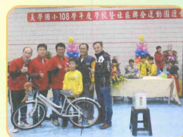
摸彩活動開心領獎

☆請於1月15日前將「寶貝我想對你說」交回輔導室，就有機會得到小禮物一份。(每年級抽出30名)