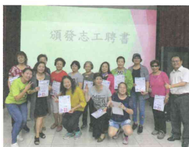
志工大會-頒發證書