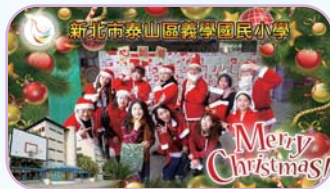
家長會扮聖誕老人