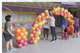
新生始業輔導場佈

義學國小自民國94年成立至今，志工們始終陪伴孩子一路成長，他們為學校服務的身影，點亮了校園每個角落。上下學路上的導護志工、班級裡的故事媽媽、圖書館裡的志工阿姨、校園路籬美化環境的園藝阿姨、週三環境教育協助回收的阿姨、幫助孩子學習的愛心補救志工以及愛心親職電話聯繫志工。我們一直以來心，存感恩的心，感謝你們無私的奉獻。