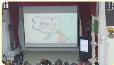
讀懂孩子的心，在家中對孩子使用輔導技巧

第四場於12月16日上午邀請親子天下專欄作家-親子教養專家-澤爸，本名魏璋志談「打開親子溝通的黃金之鑰」對於孩子說過的NG溝通。家長參與親子講座十分踴躍，可見非常關心孩子教養的問題，期待下學期的親職講座，歡迎家長再次參加，陪伴孩子一起成長。