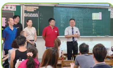
校長帶領主任、家長會長到各班 聆聽家長意見