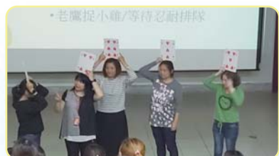
花媽帶領學員做遊戲操作

啟心房同理他人想法，而非強迫對方接受，有「對等」、「設身處地」的胸懷，建立良好的互動。壓力存在生活中，學習壓力管理前學會管理自己的情緒，增進親子的關係。