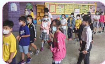
學生奉茶、點心及小卡 表達對老師的感謝