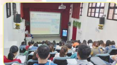
家人互動好妙方-談溝通與紓壓

啟心房同理他人想法，而非強迫對方接受，有「對等」、「設身處地」的胸懷，建立良好的互動。壓力存在生活中，學習壓力管理前學會管理自己的情緒，增進親子的關係。