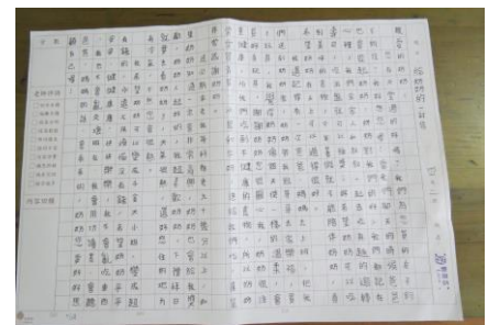
402 劉羽芯 給天堂奶奶的一封信