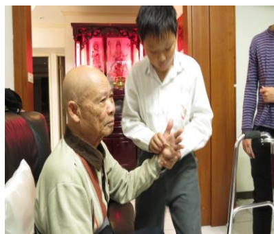
404 立昕為生病爺爺按摩