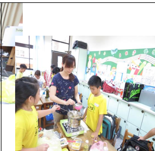
仔細看味增湯調濃度的秘訣