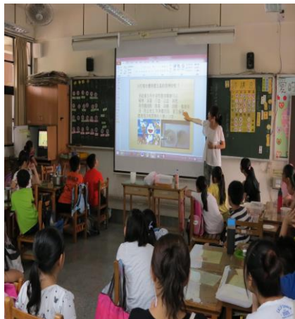
老師講述愛玉果實生長史、作法和功效是台灣特有天然果凍