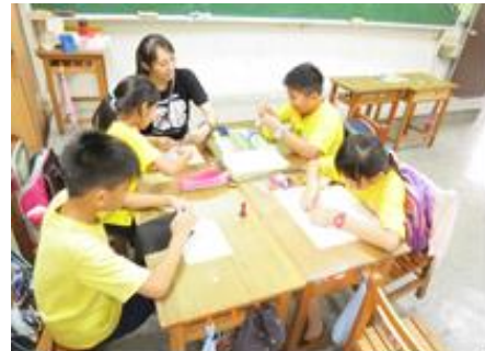
自己設計實用小包包