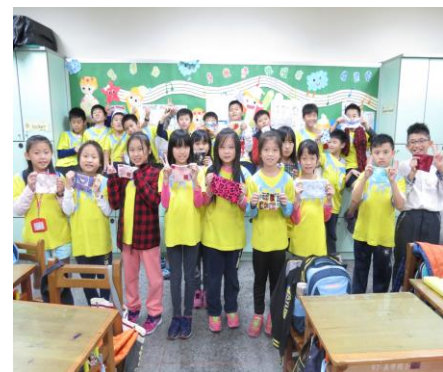
全班展示每人親手做創意小包包