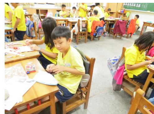
第一次拿針線要專注