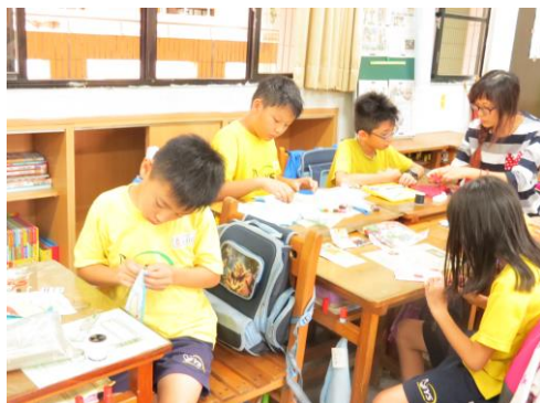
認真的小男生第一次親手做小包包