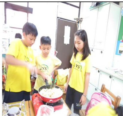
男生也會炒蛋炒飯