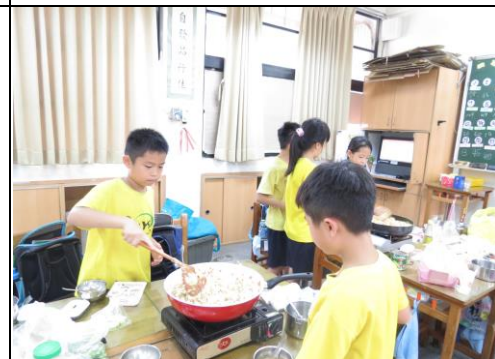
中華小廚師一級棒