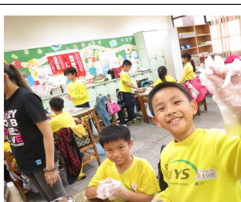
看我幸福珍珠小湯圓