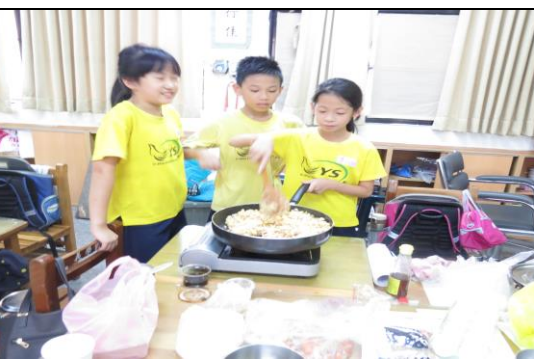
香噴噴的鮭魚蛋炒飯