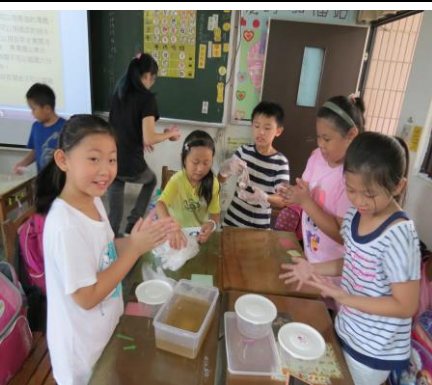
差愛玉出果膠後等半小時結凍就可以吃了。